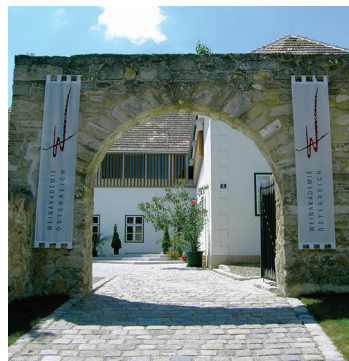
Weinakademie Österreich, Sitz im Seehof Rust