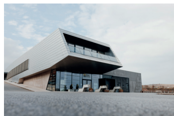
Weinakademie Österreich Krems, Weinkompetenzzentrum