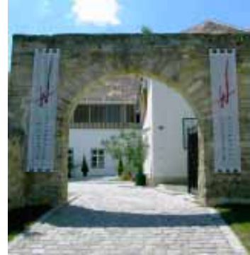
Die Weinakademie Österreich, Sitz im Seehof Rust